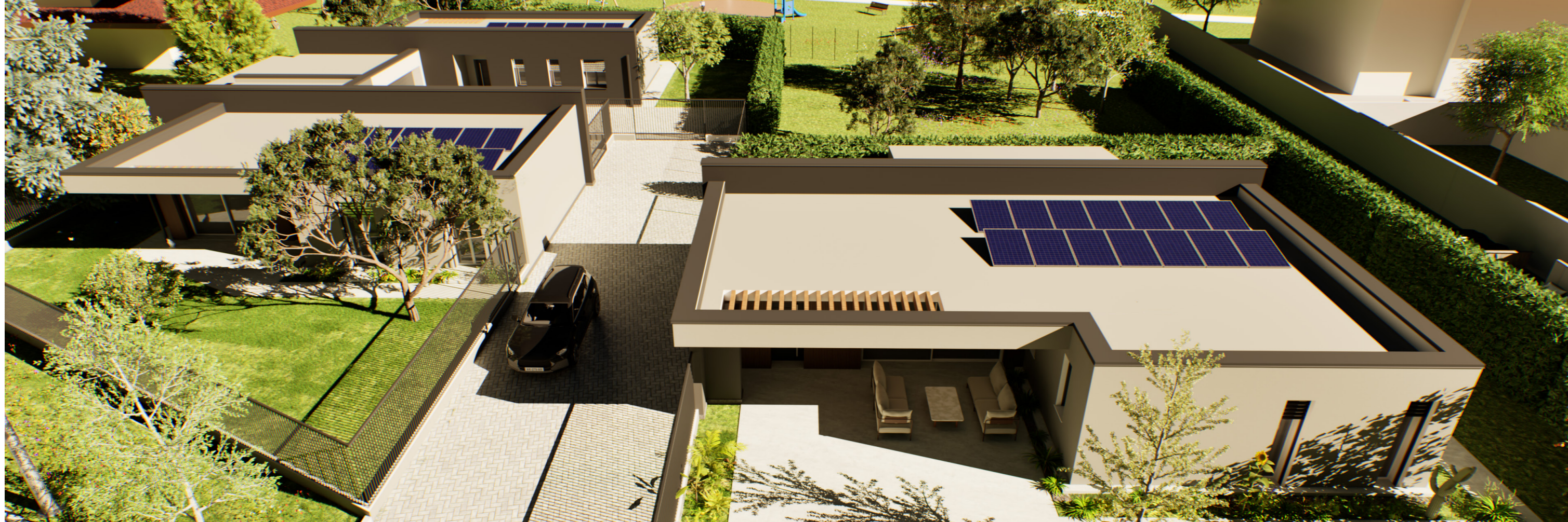
Render di progetto | Residenze VIA MARCHE | Vista Nord-Ovest